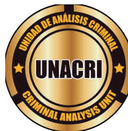
Unidad de Análisis Criminal | Colombia