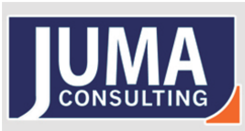
Juma Consulting | España